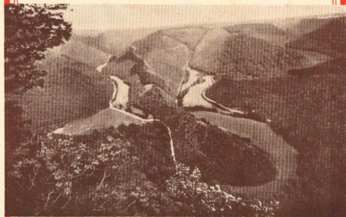
Blick ins Alfbaechtal

Nieder- Scheidweiler die ideale Sommerfrische in der Eifel